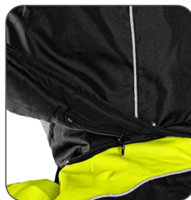
odepínací kapuce detachable hood odpinany kaptur