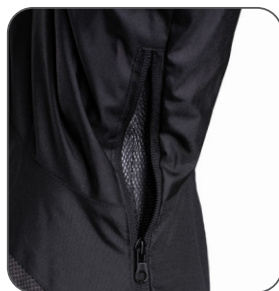
větrání v podpaží underarm ventilation wentylacja pod pachami