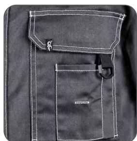
multifunkční kapsy multifunctional pockets kieszenie wielofunkcyjne