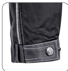
nastavitelná manžeta rukávu adjustable cuff regulowany mankiet