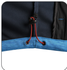
stahování v dolním okraji tightening at the bottom ściągacz w dolnej części